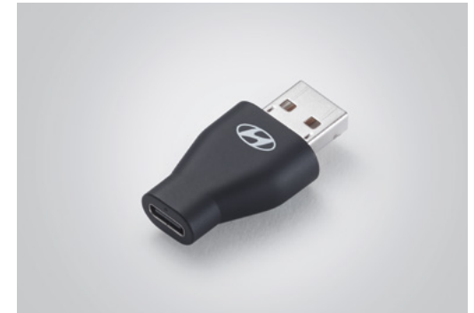
C to USB-A 변환 젠더* A to USB-C 변환 젠더*