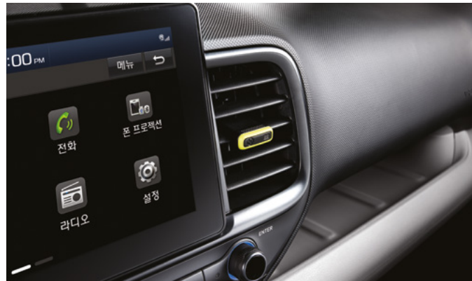
에어벤트 풀오토 에어컨