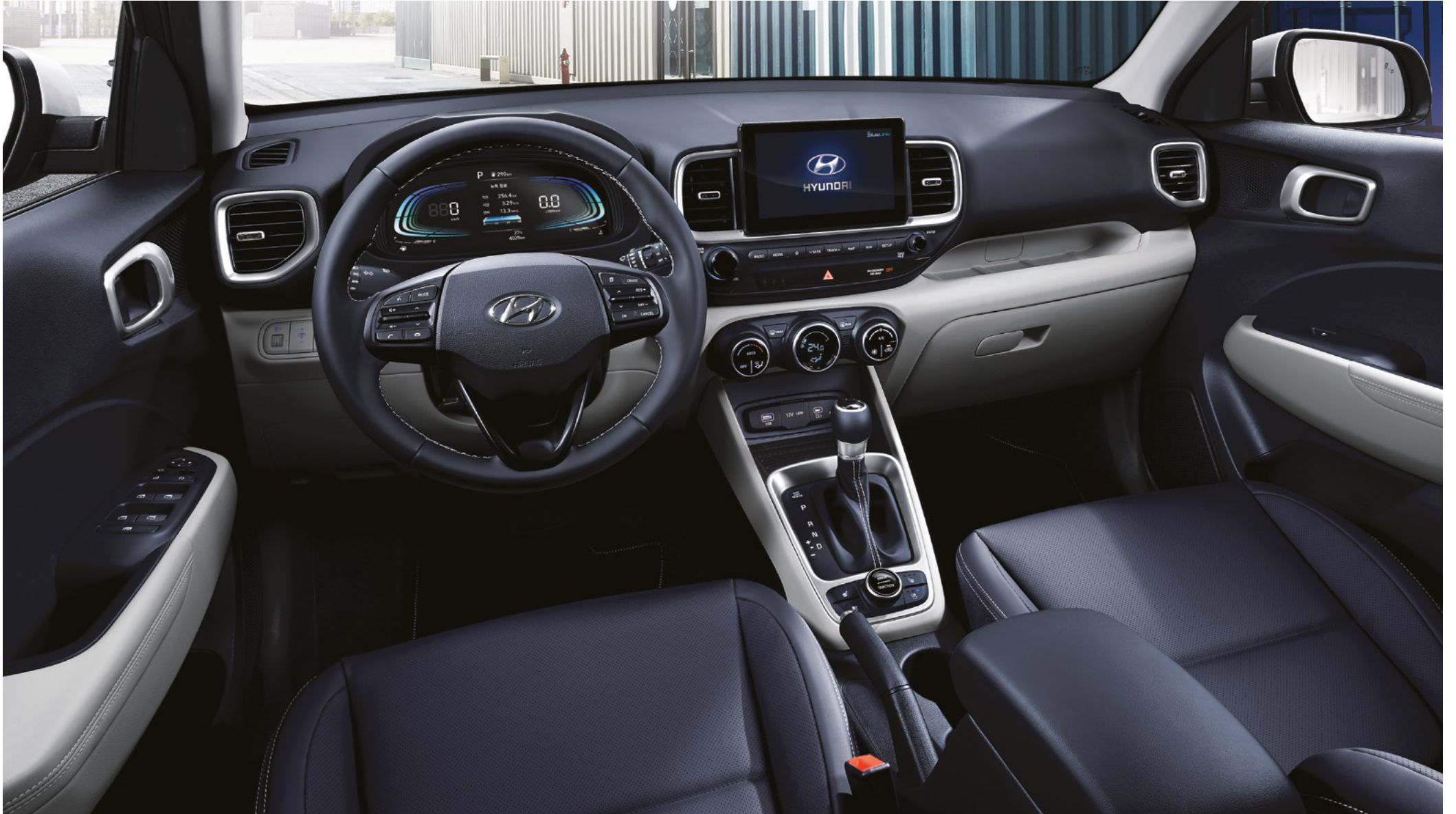
프리미엄 풀옵션(메테오 블루)

* 인포테인먼트 시스템 화면 이미지는 업데이트에 따라 변동될 수 있습니다.