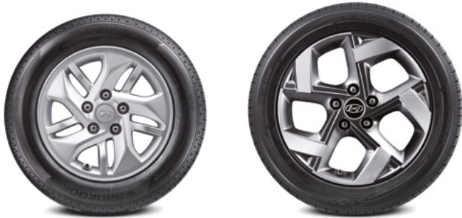
185/65R15 타이어 & 15인치 알로이 휠