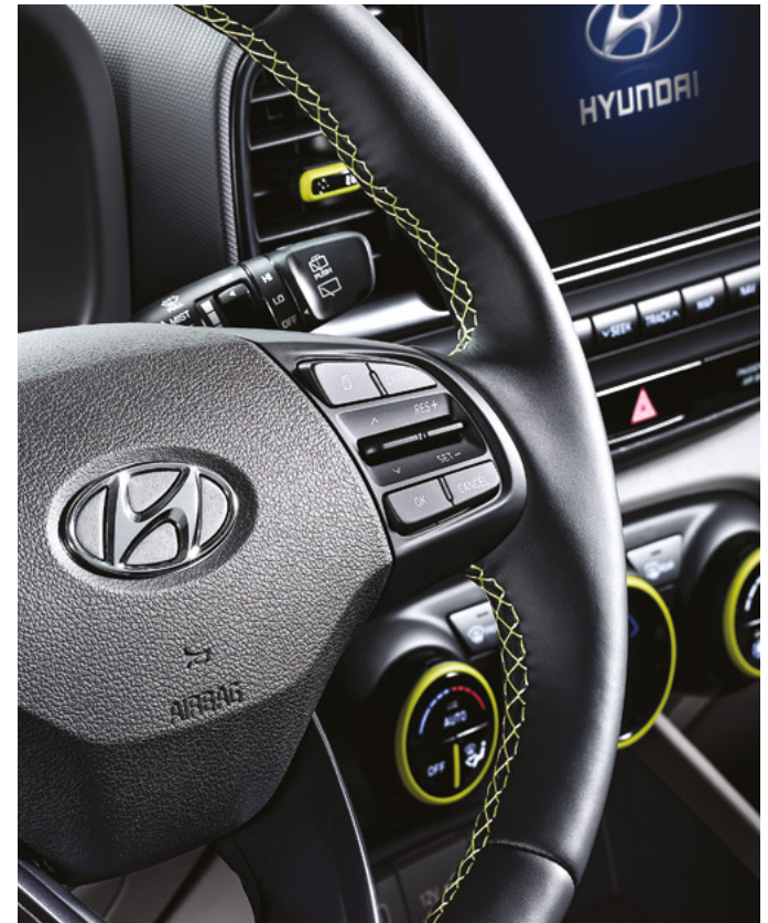
가죽 스티어링 휠 (FLUX 전용 스티치 포함)