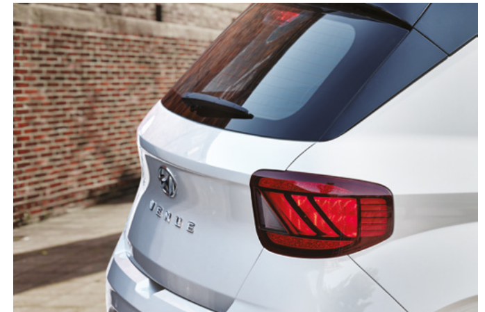
LED 리어 콤비램프 17인치 알루미늄 휠 & 타이어