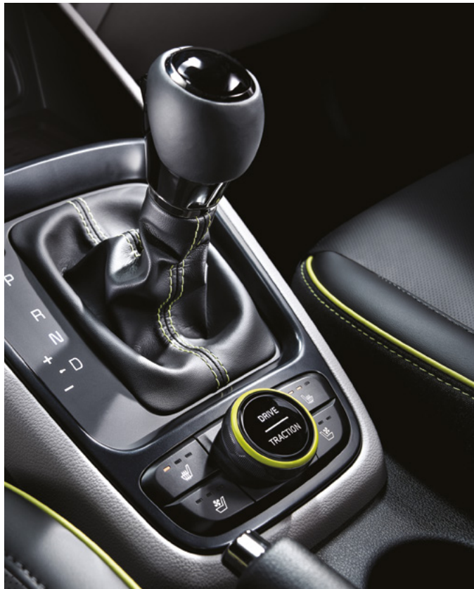
기어노브 & 2WD 험로 주행 모드 스위치