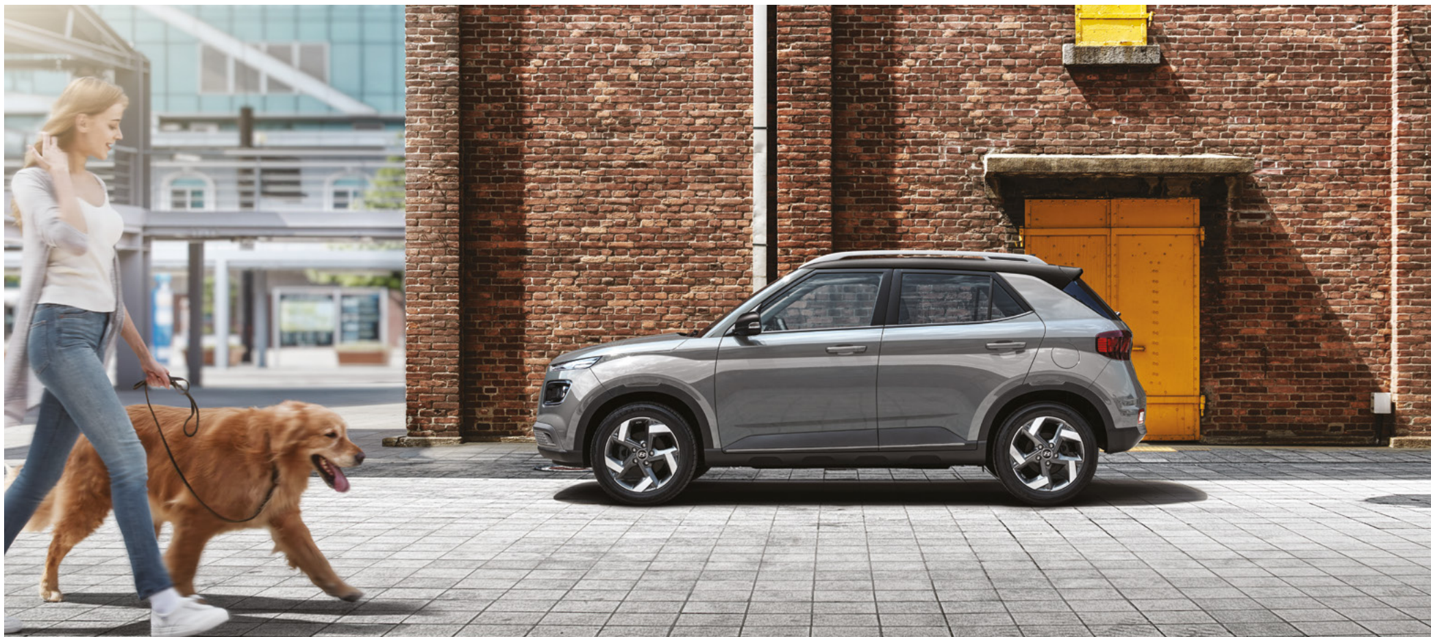
프리미엄 풀옵션(사이버 그레이 메탈릭/어비스 블랙 펄 투톤)