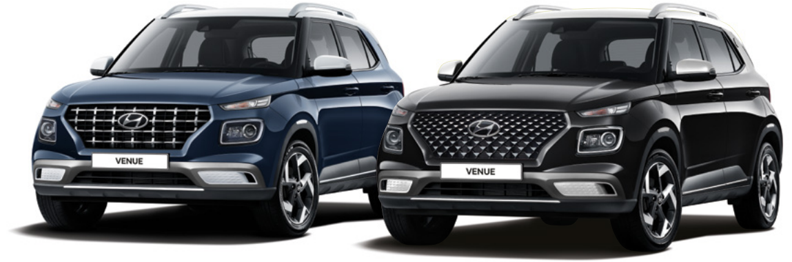
프리미엄 풀옵션(데님 블루 펄/초크 화이트 메탈릭 투톤) / 플렉스 풀옵션(어비스 블랙 펄/초크 화이트 메탈릭 투톤)