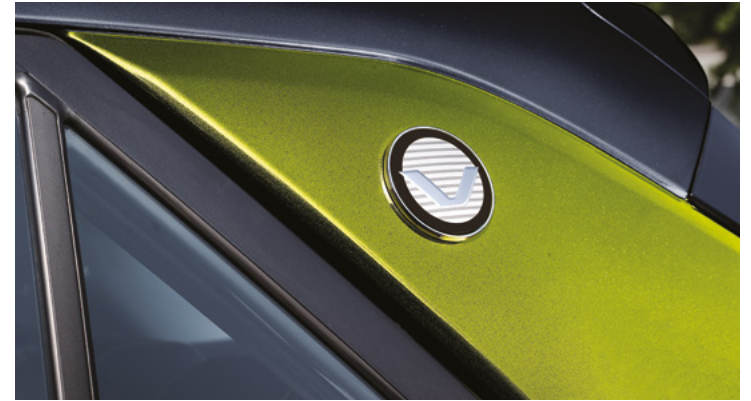
C필러 बै지 FLUX 전용 리어스키드