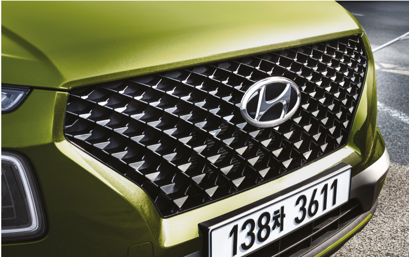
FLUX 전용 핫스탬핑 라디에이터 그릴